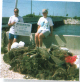
The Ocean Conservancy

Utilice receptáculos identificados para el reciclaje del hilo de pesca localizados en rampas para botes, marinas, muelles, puentes, tiendas de cebo y equipo para pesca, (bait and tackle shops) y carreteras de acceso a la playa. Estos receptáculos ya se encuentran localizados en varias áreas a través de la Florida.