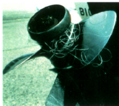
The Ocean Conservancy

Hilo de pesca impropriadamente descartado es potencialmente peligroso para todos. Cada año, ingestión accidental de hilo de pesca es causa de enfermedad, heridas y muerte para todo tipo de fauna (vida silvestre) marina. Fauna puede quedar enredada,