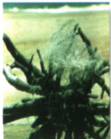
The Ocean Conservancy