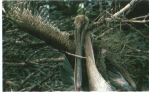
The Ocean Conservancy

Para más información sobre como ayudar voluntariamente en eventos ambientalistas de limpieza o como iniciar un proyecto de reciclaje de hilo de pesca en su área, comuníquese con la Comisión de Conservación de Fauna y Pesca de la Florida, División de Pesca Marina: FWC, División of Marine Fisheries, 2590 Executive Center Circle E, Suite 204, Tallahassee, FL 32301, www.marinefisheries.org